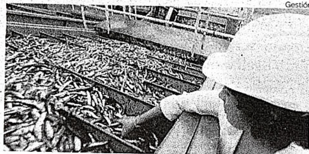
Precio pagado por la transacción alcanzó los US$ 45.1 millones.

De esta manera, Stafedouble SL ahora se queda con el 5.1% del accionariado (equivalente a 15 millones de acciones).